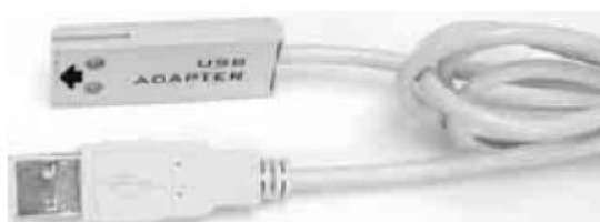
LP003 - adaptér pre komunikáciu cez USB