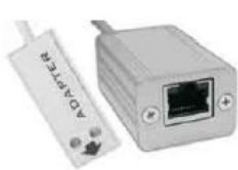
LAN adaptér LP005