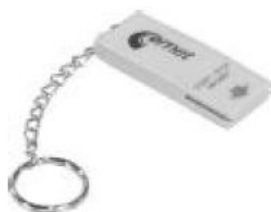
LP004 - štart / stop magnet