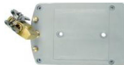
F9000 - držiak na stenu