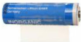
A4203 - náhradná lithiová batéria 3,6V, rozmer AA, bez vývodov