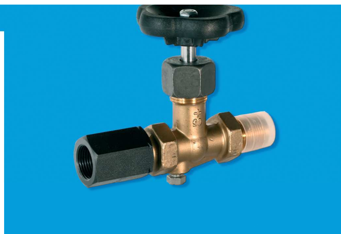
Ventil tlakomerový dvojcestný - uzatvárací